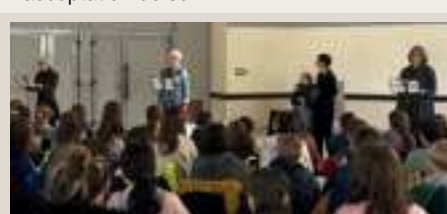
Le groupe de lecteurs À voix haute lors de leur représentation auprès des scolaires en 2024

En conclusion de ce beau projet, les lecteurs du groupe colombanais «À voix haute » leur proposeront mardi 30 juin une représentation privée de «Mongol» de Karin SERRES, un très joli texte autour de la différence et l'acceptation de soi.